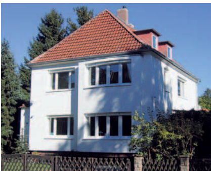
Abb. III.2.50: Stadthaus nach der energetischen Modernisierung