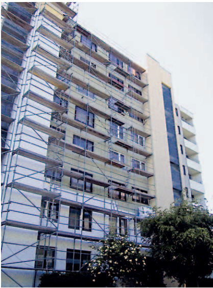
Abb. III.2.48: Nachträgliche Wärmedämmung der Außenwände