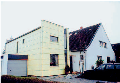
Abb. III.2.51: Energetisch saniertes Einfamilienhaus mit Anbau