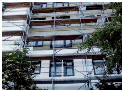
Abb. III.2.53: Wärmedämmung als WDVS