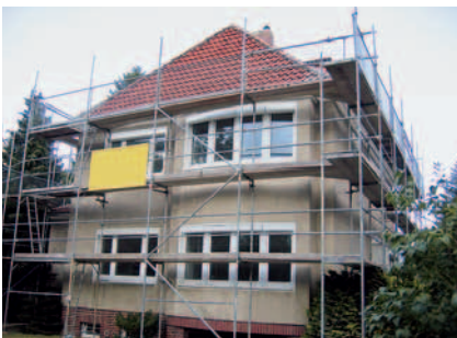
Abb. III.2.49: Stadthaus vor der energetischen Modernisierung